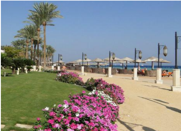
Die Hotelanlage, sehr gepflegt und...

Das Wetter in den letzten Wochen war hervorragend, die Lufttemperatur in der letzten Woche betrug 23 – 27 Grad, das Wasser ist mit 25 – 27 Grad noch immer sehr warm. „Schnorchel-ausrüstung“ kann überall – in den Hotels kostenlos – ausgeliehen werden. Bei Ausflügen mit den Schiffen immer kostenlos dabei.