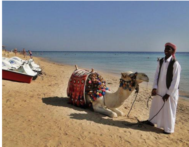
Mit dem „Wüstenschiff“ am Strand entlang

Leider haben viele noch ein Vorurteil gegen Ägypten, die partielle Reisewarnung tut das übrige noch dazu, aber in vielen Fällen sicherlich ungerecht, da diese Warnungen - auf viele Länder, so auch in Europa gelten müssten.