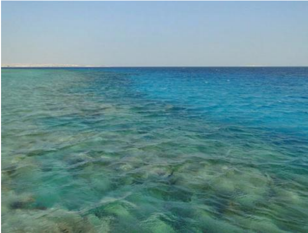
Über dem Riff

Das Grand Makadi Hotel, lediglich 18 km von Hurghada entfernt, bietet glasklares, blau-türkis gefärbtes Meer mit einem bunten Riff, welches weltweit den Vergleich nicht zu scheuen braucht. Ja ich erlaube mir nach Aufthalten auf den Malediven, in der Südsee und in Asien festzuhalten, dass sich hier das Riff, die Korallen noch in den schönsten Farben – zum Gegensatz von vielen schon „toten“ Riffen – zeigen.