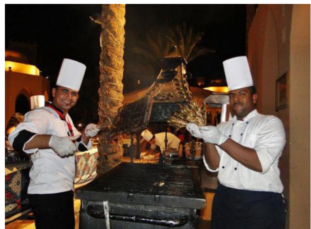
Die Köche im Hotel erstellen täglich hervorragende Spezialitäten

In fast allen Hotels in der Makadi Bay liegt das „Hausriff“ leicht erreichbar, auch für ungeübte Schnorchler nahe dem Strand. Unbeschreiblich schön die bunten Korallen, die große Zahl der Fische. Das warme Wasser erlaubt es außerdem darin stundenlang zu schnorcheln und dabei die schönsten Unterwasseraufnahmen zu machen.