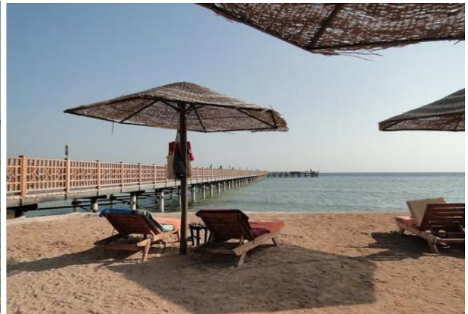
Der Weg hinaus zum Riff