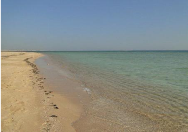
Der Strand vor dem Hotel