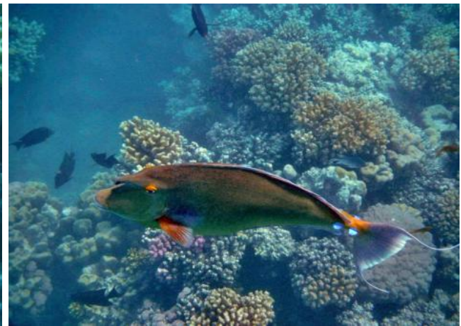
Gar nicht scheu; der "Langnasendoktorfisch"

In der letzten Woche waren hunderte Deutsche und Österreichische Touristen mit mir vor Ort. Allein 8 Rückflüge nach Deutschland/Österreich/ u. Schweiz am letzten Samstag – 1200 Touristen wechselten sich ab - sollen meine Aussage dazu bekräftigen. In zahlreichen Gesprächen am Strand und am Abend an den Bars ließen die meisten erkennen, dass sie mit ihrer Wahl des Hotels sehr zufrieden waren und wiederkommen möchten. Viele dieser Gäste tragen schon das „goldene Band“, welches erkennen lässt, dass sie bereits mehr als 10 Aufenthalte in „ihrem“ Hotels aufzuweisen hatten.