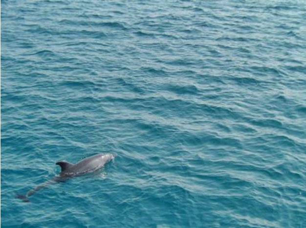
„Schiffsbegleitung“ auf hoher See

Wir waren von unseren Entdeckungen am „Riff“, zwischen den Fischen, Schildkröten und den so bunten Korallen einfach nur begeistert und wollen gleich im nächsten Jahr wieder hierher in die MAKADI Bay, ins „The Grand Makadi“ zurückkehren.