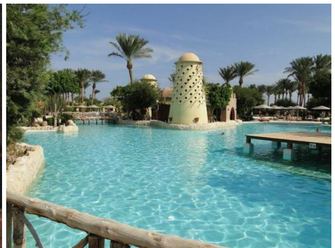
Die Poollandschaft im Gran Makadi