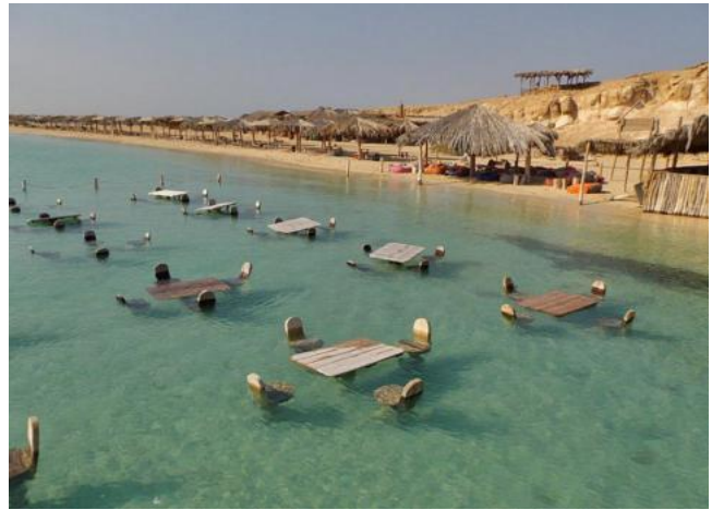
Der Strand in der „Orange Bay“

Die Anreise ab Wien beträgt 4 Stunden. Die Kosten eines wöchentlichen Aufenthaltes mit Flug, Deluxe -Zimmer (auch Suiten stehen zur Auswahl ), All Inclusive ( auch mit sämtlichen – üblichen - Getränken ) bewegen sich zur Zeit zwischen 450 – 600 Euro.