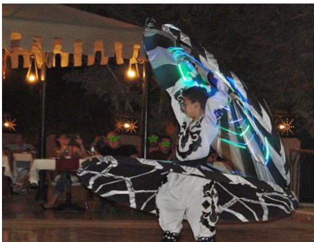
Der Tanz des „Derwisch“

In der letzten Woche waren hunderte Deutsche und Österreichische Touristen mit mir vor Ort. Allein 8 Rückflüge nach Deutschland/Österreich/ u. Schweiz am letzten Samstag – 1200 Touristen wechselten sich ab - sollen meine Aussage dazu bekräftigen. In zahlreichen Gesprächen am Strand und am Abend an den Bars ließen die meisten erkennen, dass sie mit ihrer Wahl des Hotels sehr zufrieden waren und wiederkommen möchten. Viele dieser Gäste tragen schon das „goldene Band“, welches erkennen lässt, dass sie bereits mehr als 10 Aufenthalte in „ihrem“ Hotels aufzuweisen hatten.