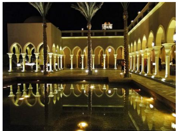
„1001 Nacht“ - der Innenhof, wie ein Palast

Ich komme soeben aus der Makadi Bay zurück, der Abschied ist mir nicht leicht gefallen. Tausende Touristen verbringen zur Zeit ihren Urlaub rund um Hurghada, die Hotels sind ziemlich voll, 90 % wird deutsch gesprochen. Aus Deutschland, Österreich, Schweiz, England und vielen weiteren europäischen Staaten gibt es inzwischen dutzende, wöchentliche Flüge nach Hurghada, die Nachfrage wird immer größer.