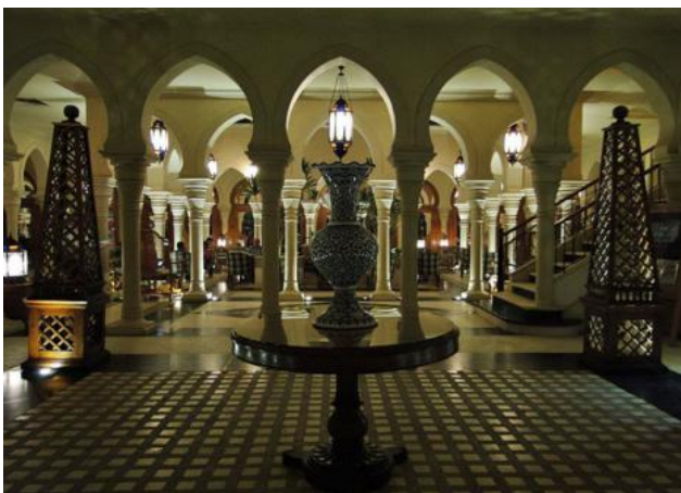
„The Grand Hotel MAKADI – die Lobby

Ich möchte Dir/Euch/Ihnen heute ein besonders schönes Reiseziel etwas näher bringen, welches alles hat, um einen erholsamen und erlebnisreichen Aufenthalt zu garantieren, nämlich die MAKADI – Bay bei Hurghada, speziell das „The Grand Makadi“ Hotel.