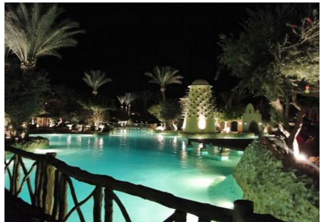
... romantisch bei Nacht...

Sicherheit für die Gäste wird in hohem Maße stets gewährleistet. Ausflüge ins Land sollten mit dem Veranstalter gut abgesprochen werden.