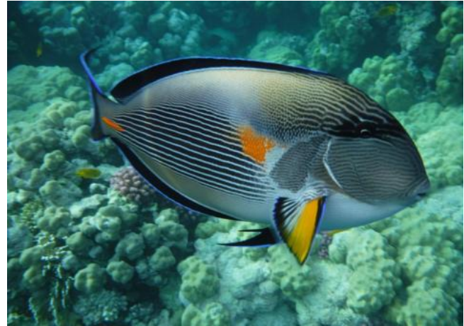
Begrüßung unter Wasser durch den "Sohaldoktorfisch"

Das Hotel, bestens gepflegt, mit 5 ägyptische Sternen ausgezeichnet, erfreut das Herz jeden Besuchers. Die Verpflegung vor Ort ist bereits dem internationalen Standard angepasst. Das Preis-Leistungsverhältnis ist noch immer weit günstiger als in allen Ländern Europas.