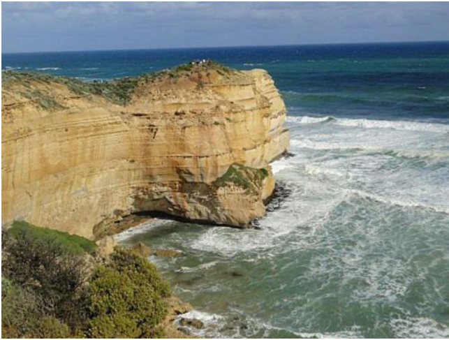
...Elephant- Rock ...

Anschließend unser Besuch beim Loch Ard Gorge. Wir spazierten vom Parkplatz durch die niederen Büsche zum Meer. An den gelben, schroffen Felsen schlugen hohe Wellen an, von den Klippen schauten wir zum Elephant Rock, eine gefährliche Stelle, wo schon einige Schiffe zerschellten.