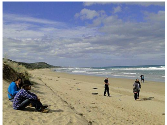
... mit seinem Strand ...