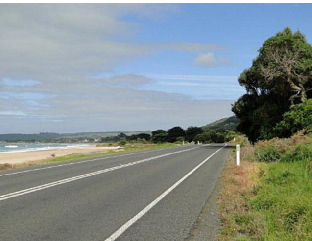
...GOR bei Lorne ...

Unsere letzte Etappe auf der GOR begann anschließend, die Fahrt nach Torquay, wo sich das Ende der GOR (für uns) oder die Einfahrt zur GOR ( aus Richtung Melbourne ) befindet.