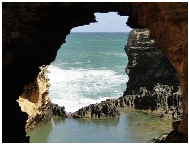
The Arch (oben) und die Grotten...