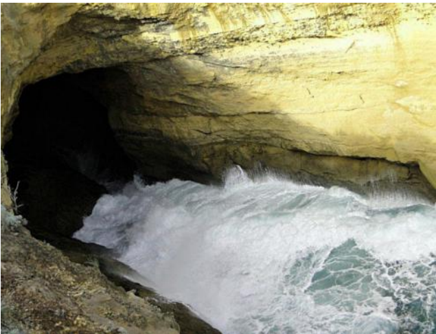
... Thunder Cave...

Wir fahren dann ein Stück weiter zum nächsten Parkplatz, von hier ein kurzer Weg zur Thunder Cave – das Wasser schoss in eine Höhle, spritzte hoch auf und floss wieder hinaus – ein ewiger Kreislauf. Wir gingen noch weiter zu den Spitzen der Klippen, bei Broken Head waren schon Felsenbrücken ins Meer gestürzt.