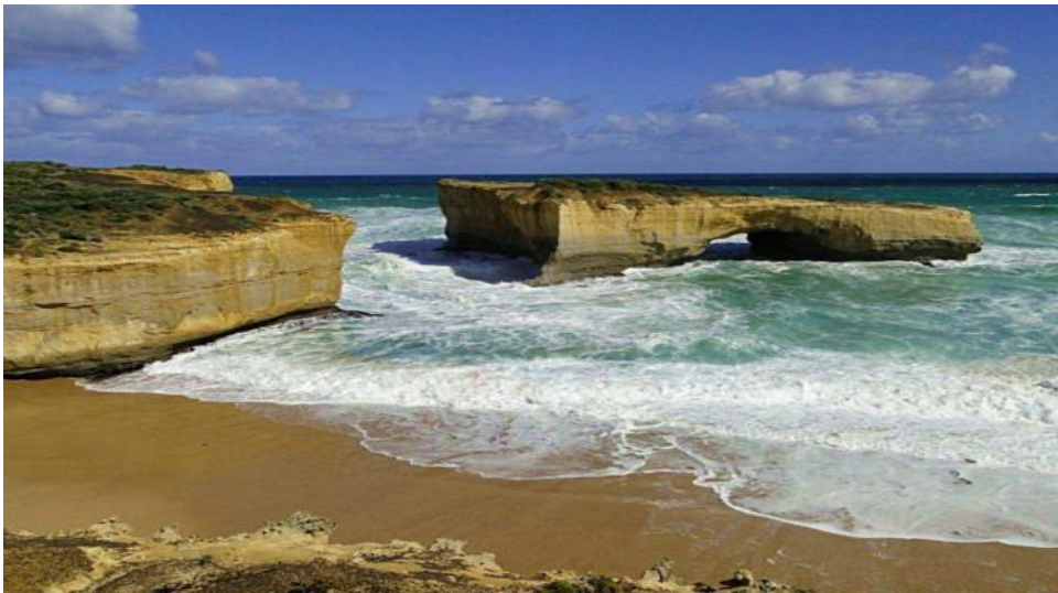
London – Arch, früher London Bridge ( der erste Bogen ist am 15.1.1990 eingebrochen )

Da dieser, heute weltberühmter Straßenzug inzwischen eine Touristenattraktion ersten Ranges geworden ist und als Wirtschaftsfaktor ( Hotels, Restaurants, Motels, Souveniergeschäfte, Surf u.Tauchsulen usw. ) nicht mehr wegzudenken ist, wurde diese, nach 14-jähriger Bauzeit geschaffene Küstenstraße am 7. April 2011 als DENKMAL in die Australien National HERITAGE-Liste eingetragen.