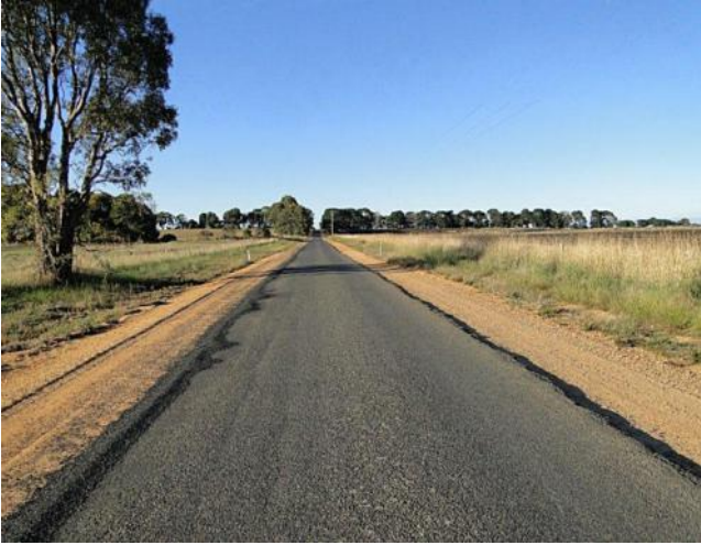
.... im Hinterland von Lorne ...