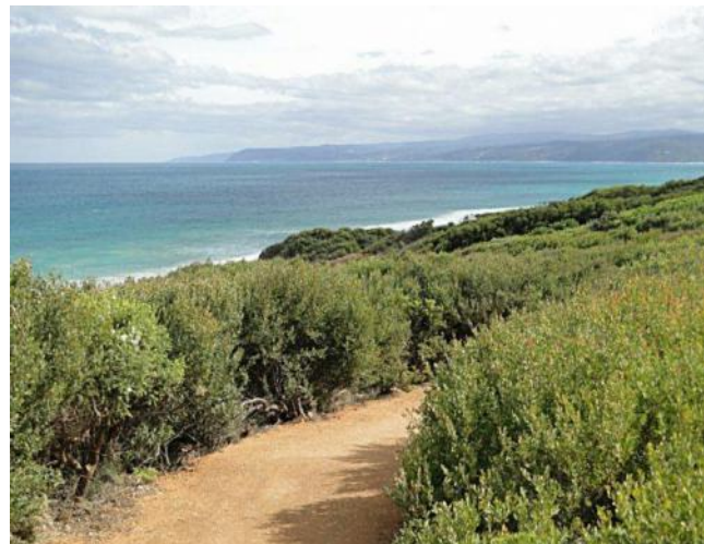
... ein letzter Blick zurück....

Melbourne war schon am Wegweiser zu lesen und wir bogen ins Landesinnere ab. Die Skyline von Melbourne war schon bald zu sehen, doch das Navi führte uns in die entgegengesetzte Richtung. Auf der Landkarte konnten wir den zick-zack Kurs auf Nebenstraßen Richtung Flughafen verfolgen. So folgten wir den Anweisungen und umfuhren Melbourne. Der Verkehr wurde immer dichter und um 18 Uhr trafen wir beim Hotel Holiday Inn ein.