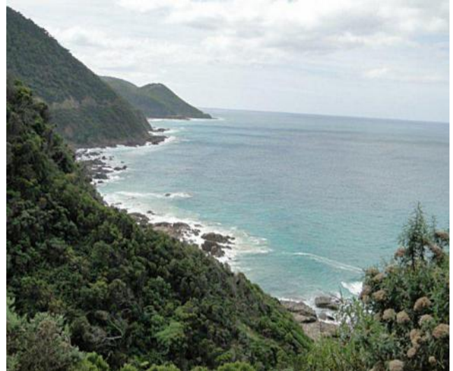
...immer wieder Fotostopps....