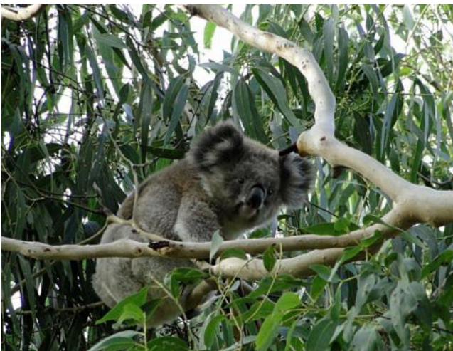
...das ist mein Baum....