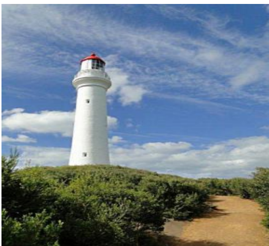
Splitpoint Leuchtturm, 1891 in Aircys Inlet errichtet