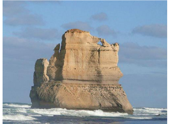
...Fels in der Brandung...