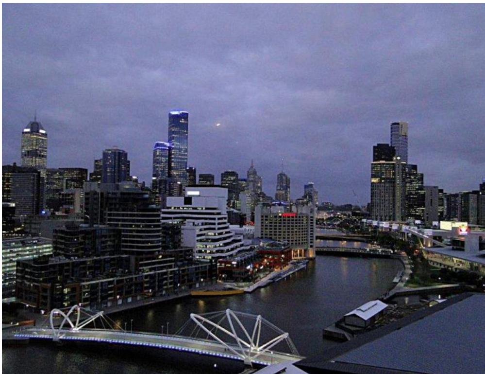
... Blick über den Yarra – River in Melbourne ....

Schon allein die Fahrt über die „Gread Ocean Road“, diesem DENKMAL in Australien, ist ein Erlebnis, welches man unbedingt in die Reiseplanung aufnehmen sollte. Um sich alle „Touristenziele“ anzusehen, empfehle ich Ihnen/Dir einen Aufenthalt von zumindest 3 Tagen an der „GOR“.