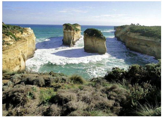
...Loch Ard Gorge...

Wir fahren dann ein Stück weiter zum nächsten Parkplatz, von hier ein kurzer Weg zur Thunder Cave – das Wasser schoss in eine Höhle, spritzte hoch auf und floss wieder hinaus – ein ewiger Kreislauf. Wir gingen noch weiter zu den Spitzen der Klippen, bei Broken Head waren schon Felsenbrücken ins Meer gestürzt.