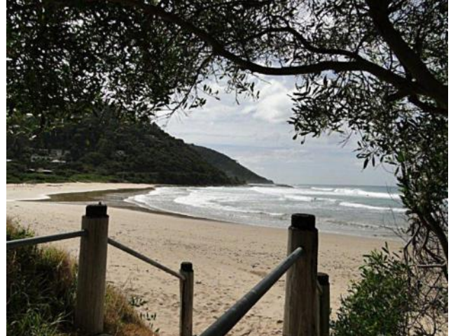
... Strände bei Torquay ....