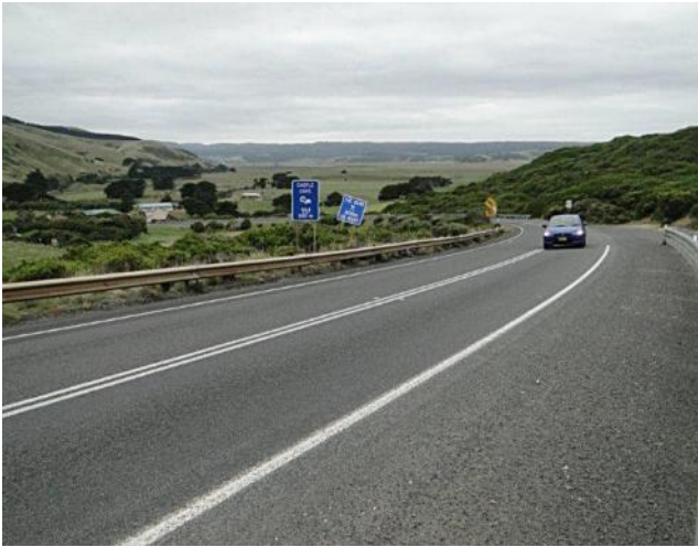
...on the Road...

Bei der Bucht machten wir einen Fotostopp, dann fuhren wir auf der schönen, kurvenreichen Straße durch einen Eukalyptuswald entlang der Küste.