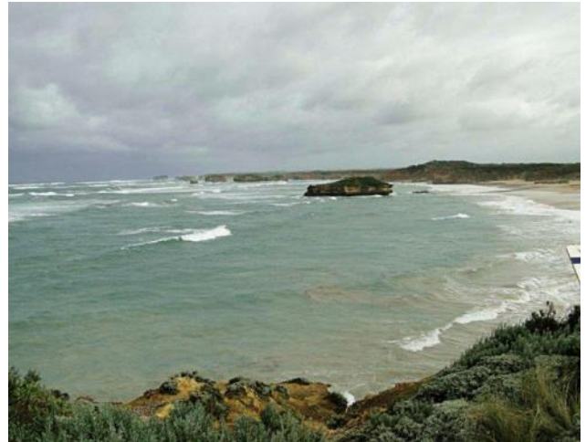
...Strand bei Port Campbell....

Port CAMPBELL– heute eine aufstrebende Stadt, welche von den Touristen in großer Zahl als Ausgangspunkt zum Besuch der spektakulären Küste und des gleichnamigen Nationalpark benützt wird.