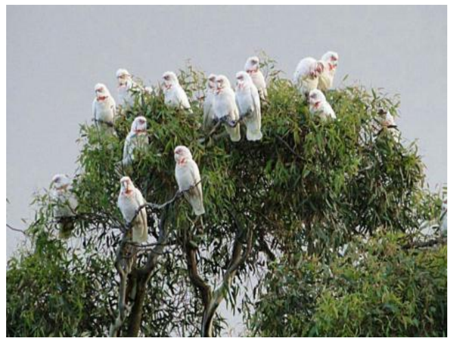
...und auch ihr Landeplatz....

Nach einer Linkskurve standen Menschen auf der Straße – am Eukalyptusbaum über der Fahrbahn saß ein großer Koala und futterte genüsslich Blatt um Blatt. Die Autos und seine Zuseher konnten ihn nicht aus der Ruhe bringen. Im Wald entdeckten wir noch zwei Koalas, einer schlief in einer Astgabel, der zweite war auf Futtersuche im dichten Geäst. Wir konnten uns fast nicht trennen.