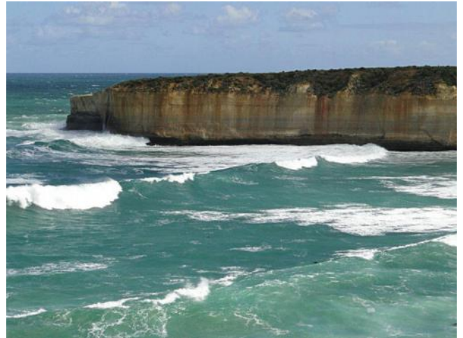
... die Küste bei Sturm und hoher Wellen...