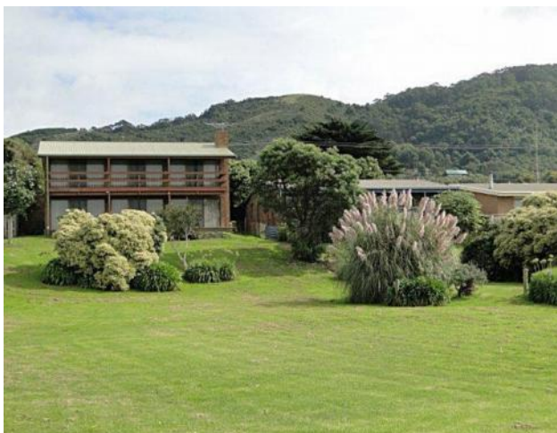
... Apollo Bay ...