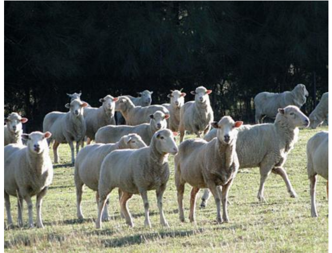
..“Cheese“ fürs „Gruppenfoto“...