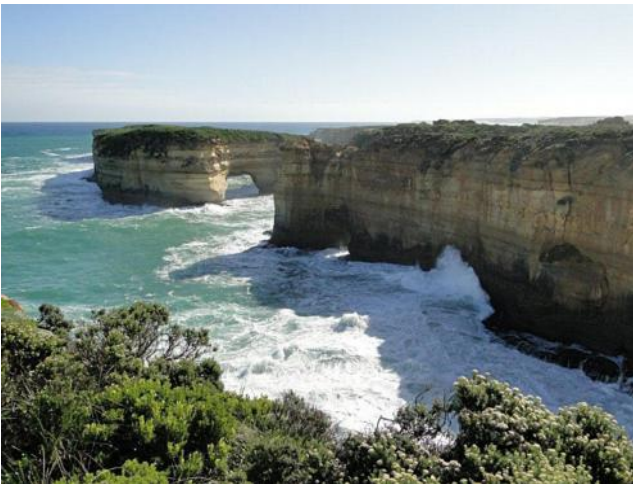
...von den Wellen umwogen...