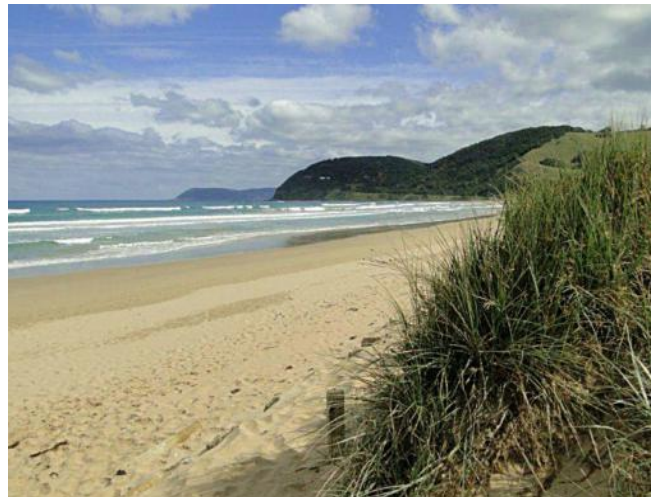
...Strand von Lorne...