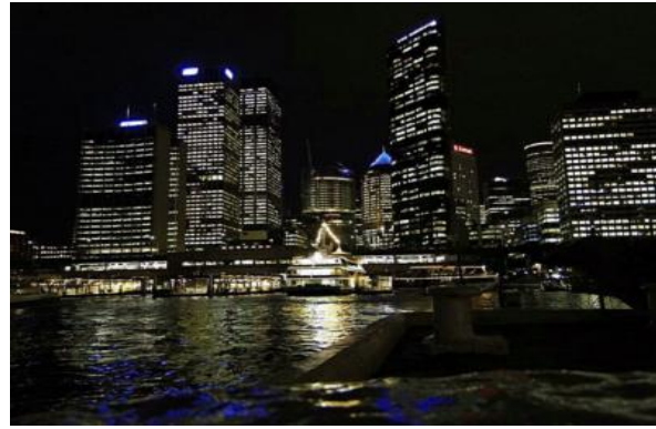
Darling Harbour bei Nacht