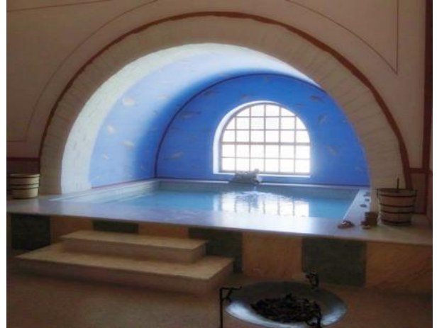
Römerbad im Haus