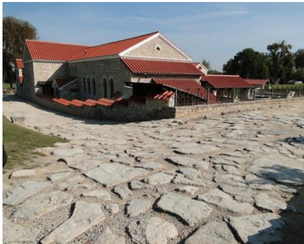
...auf der Römerstraße durch den Park...

Der Archäologische Park von Carnuntum ist von März - November geöffnet und von Wien aus in ca einer Stunde ( auch Bahnreise möglich ) zu erreichen.