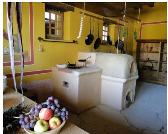
..in der Küche..