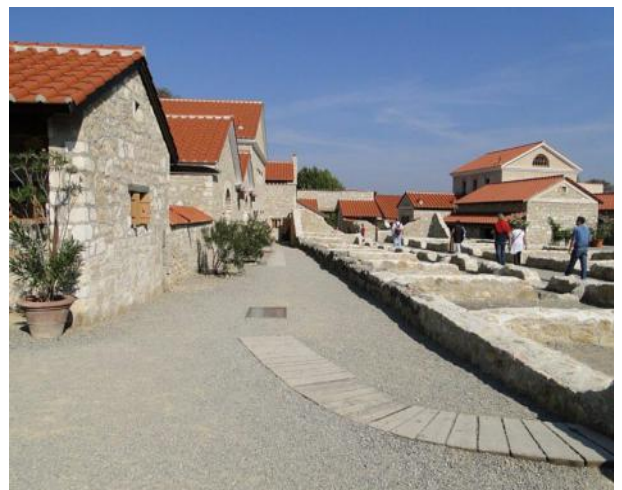
Der archäologische Park Carnuntum

Alle notwendigen, weiteren INFOS ( Anreise, Öffnungszeiten, Führungen, Kontakt, Anmeldungen und die detaillierte Geschichte ) können SIE aus der ausführlich und ungewöhnlich aufwendig, auch mit Bildgalerien gestalteten Webseite zu "CARNUNTUM" entnehmen, hier