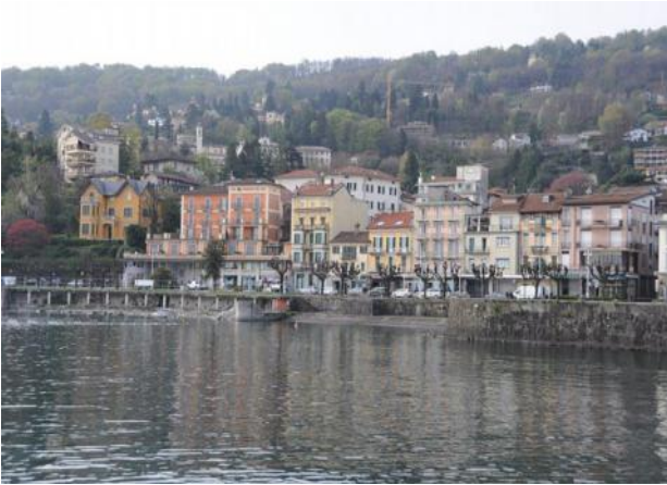
Blick zurück auf den Ort STRESA