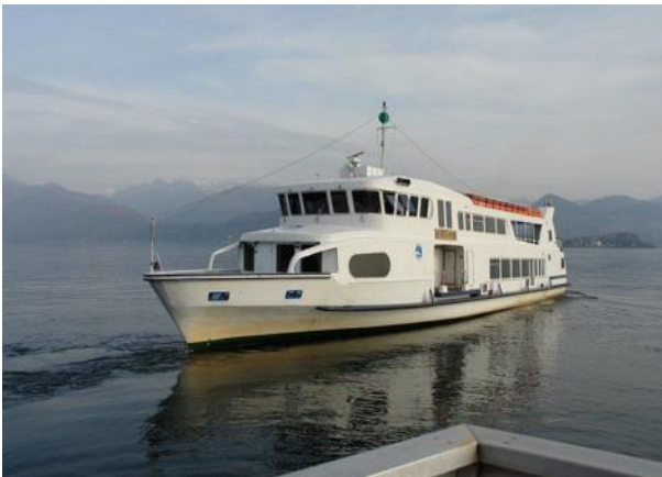
Schiffsbetrieb am Lage Maggiore

Egal wo man am Ufer des Sees Quartier genommen hat, ist es ein leichtes, eine der Inseln, aber auch die Villa Taranto direkt zu erreichen, da jeder Ort durch die Schiffe des staatlichen „Schiffsbetriebs“ mehrmals täglich angelaufen wird. Meine Empfehlung dazu wäre es, die Unterkunft in den Orten Baveno oder Stresa zu wählen.