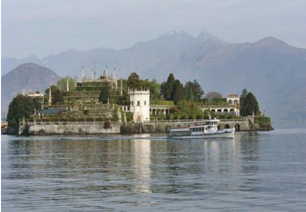
Vorbei an „Isola Bella“ ..... und .....