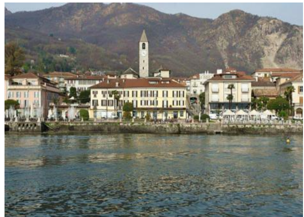
Vorbei an Baveno

Besteigt man, so wie wir, in Stresa eines der Schiffe, so führt der Weg über den Hafen Bavenos in der Folge an der „Isola Bella“, im Verlauf auch an der Insel Pescatore und zuletzt an der „Isola Madre“ vorbei.