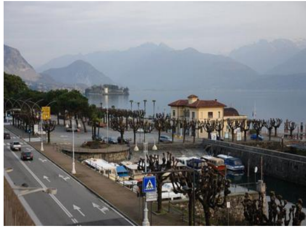
Blick zur Isola Bella

Zu einem besonderen „Besuchermagnet“ hat sich der Besuch der botanischen Gärten auf der „Isola Bella“, der „Isola Madre“ und als eine besondere Attraktion, der Rundgang im botanischen Garten der „Villa TARANTO“, am Ufer des Sees bei Verbania gelegen, entwickelt. Jährlich werden diese Gärten von mehr als 150.000 Besuchern aufgesucht.