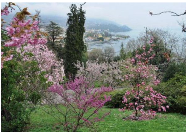
Blick auf den Hafen von Verbania

Unmittelbar danach wird Verbania angelaufen, wo auch der kleine Hafen zum Besuch der Villa Taranto liegt. Nur wenige Schritte sind nach dem Verlassen des Schiffes notwendig, um den Eingang des botanischen Garten der Villa Taranto zu erreichen.