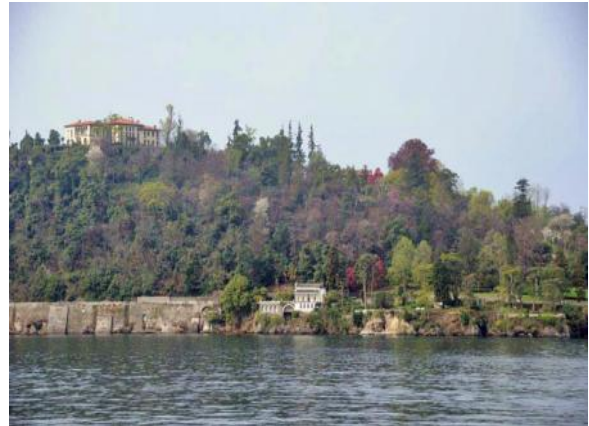
Villa TARANTO – unser Ziel am Hügel

Egal wo man am Ufer des Sees Quartier genommen hat, ist es ein leichtes, eine der Inseln, aber auch die Villa Taranto direkt zu erreichen, da jeder Ort durch die Schiffe des staatlichen „Schiffsbetriebs“ mehrmals täglich angelaufen wird. Meine Empfehlung dazu wäre es, die Unterkunft in den Orten Baveno oder Stresa zu wählen.