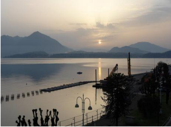
Sonnenaufgang am Lago Maggiore

Besucht man im April den Lago Maggiore so ist das die beste Zeit, um dem Touristenstrom der Hauptsaison zu entgehen. Denn der Lago Maggiore wird in den Sommermonaten geradezu von Besuchern „gestürmt“.