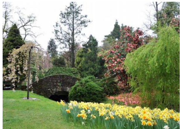
Am Weg durch den botanischen Garten der Villa TARANTO

Unmittelbar nach dem Eingang werden die Besucher anhand einer guten Wegbeschreibung ( folgen sie den Zahlen 1 – 12 ) in Terrassengärten und Pflanzen - Themenbereiche geführt, wo infolge eine Vielzahl von einheimischen und exotischen Pflanzen, oft in lieblichen Ensembles gepflanzt, präsentiert werden.