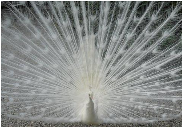
Blick in das „Federnrad“ des Pfaus auf Isola Bella

Zu einem besonderen „Besuchermagnet“ hat sich der Besuch der botanischen Gärten auf der „Isola Bella“, der „Isola Madre“ und als eine besondere Attraktion, der Rundgang im botanischen Garten der „Villa TARANTO“, am Ufer des Sees bei Verbania gelegen, entwickelt. Jährlich werden diese Gärten von mehr als 150.000 Besuchern aufgesucht.