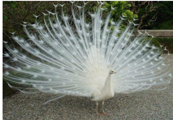
„Begegnung auf den Inseln“

Unmittelbar danach wird Verbania angelaufen, wo auch der kleine Hafen zum Besuch der Villa Taranto liegt. Nur wenige Schritte sind nach dem Verlassen des Schiffes notwendig, um den Eingang des botanischen Garten der Villa Taranto zu erreichen.