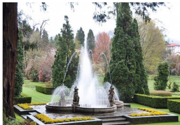
Am Eingang zum botanischen Garten