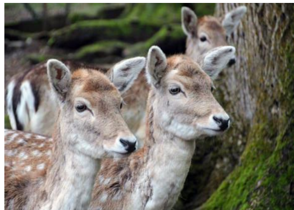
„Woher seid IHR denn ? „

Auch wir hatten den Besuch dieser botanischen Gärten in unser Programm aufgenommen und besuchten dabei als ersten „Garten Eden“, den botanischen Garten der Villa TARANTO. Ich werde anhand dieses kurzen Reisetipps versuchen, Ihnen/Euch dieses so eindrucksvoll an einem Hügel, direkt am Ufer des Lago Maggiore gelegene, kleine Paradies etwas näher vorzustellen.