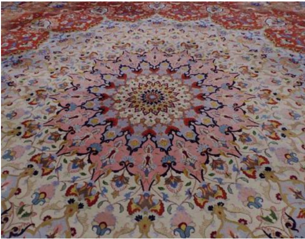
... als größter Teppich seiner Art....

Das Innere der Moschee ist mit einem 5630 Quadratmeter großen, handgeknüpften Teppich aus Iran ausgelegt, das Gewicht des Teppichs beträgt 47 Tonnen. Zur Herstellung des im Iran handgeknüpften Teppichs wurden 35 Tonnen Wolle und 12 Tonnen Baumwolle benötigt. "Er" gilt als größter Teppich seiner Art auf der Welt. Die Baukosten der Anlage beliefen sich auf 545 Millionen US-Dollar.