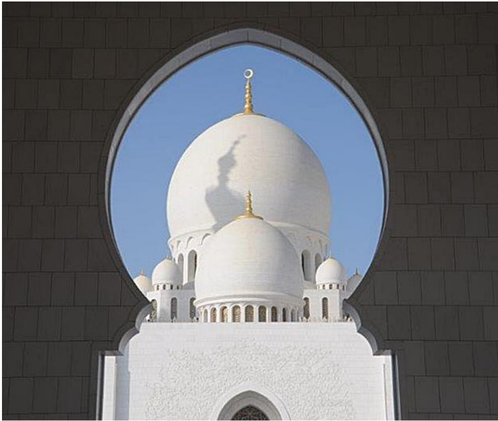
Der Blick zur Hauptkuppel