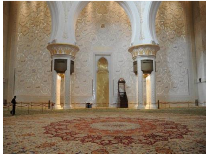
...Richtung Mekka ....

Für einen ausführlichen Besuch benötigt man mehr als 2 Stunden. Der Besuch dieser Moschee ist wohl ein "Pflichttermin" jeden Besuchers in Abu Dhabi. Für den Besuch durch Frauen gilt eine besondere, strenge Kleidervorschrift.